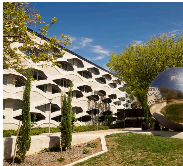
澳大利亚国立大学——堪培拉

请务必在澳大利亚移民及边境保护部网站（ www.border.gov.au ）和院校网站上仔细查看学生签证信息中对英语语言的要求。